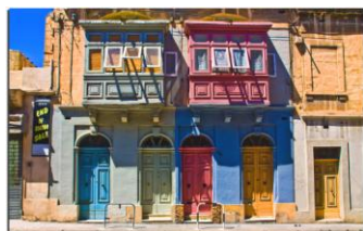
La Valette, maison typique

Après un bon petit déjeuner, nous prendrons un moment pour faire connaissance et recevoir des informations sur Malte, son histoire, sa géographie et sur les découvertes que nous ferons ; puis nous rejoindrons La Valette, capitale actuelle et magnifique ville historique. Une première approche par une petite balade dans la ville fortifiée nous mettra en appétit tant sur le plan « découverte » que physique ! Un temps de repas libre s'en suivra.