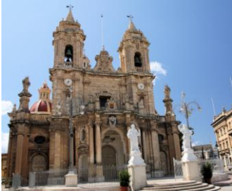
Eglise de Zabbar

Après ces visites, nous irons nous plonger dans l'ambiance d'un petit port typiquement maltais, Marsaxlokk, sur la côte est. Nous y mangerons et pourrons profiter d'une balade dans le marché sur les quais.