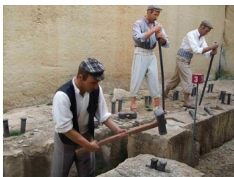
Le travail de la pierre