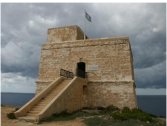
Tour de garde de Dwejra

Aujourd'hui, nous quitterons l'île... pour rejoindre sa petite sœur Gozo. Un trajet de 25 minutes en ferry nous permettra de la rejoindre tout en admirant les deux plus petites îles qui se trouvent entre deux : Comino et Cominotto.