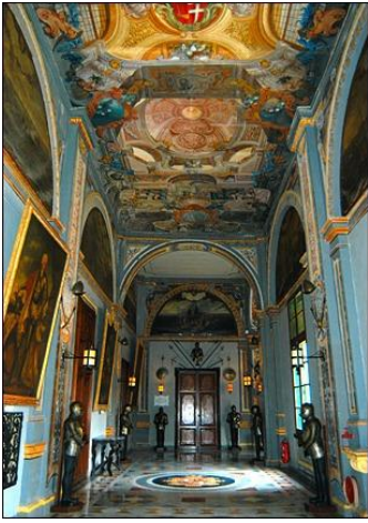
Palais des grands maîtres

sites mégalithiques, avec, en particulier, des maquettes de plusieurs d'entre eux. Nous ferons également connaissance avec la fameuse « sleeping lady » (statuette d'une dame qui dort), âgée de plus de 4000 ans, retrouvée dans l'Hypogée de Hal Saflieni.