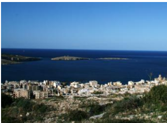
Baie et îlots St Paul

Après le petit déjeuner, nous rejoindrons l'ancienne capitale de Malte, Mdina, au centre de l'île, ville fortifiée sur un promontoire.