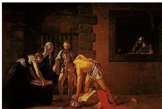
Peinture du Caravage

Après le petit déjeuner, départ pour Mosta et sa fameuse église ronde. Il s'agit de la 4 ème plus grande coupole au monde, la première étant à St Pierre de Rome et la troisième à... Gozo (les gozitains ne se lassent pas de le rappeler aux maltais...)