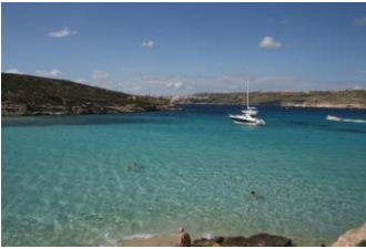
Le lagon bleu...

C'est une journée libre qui s'offre à nous : repos ou découvertes, selon les goûts de chacun !