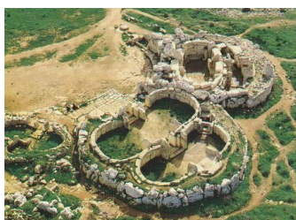
Site de Mnejdra

Après le petit déjeuner, nous traverserons l'île dans sa largeur pour rejoindre les « grottes bleues ». Si la mer est calme, ceux qui le souhaitent pourront monter dans un petit bateau et faire un tour d'une vingtaine de minutes* à la découverte de grottes reflétant un magnifique bleu-turquoise. C'est le matin que la lumière y est la plus belle !