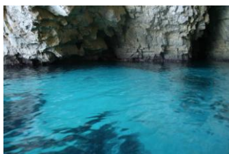
L'une des « grottes bleues »