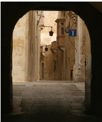
Mdina, la cité silencieuse...