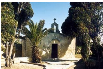
Chapelle de Hal Millieri