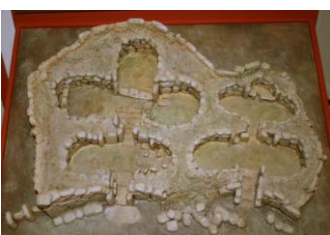
Ggantija, maquette du site

Puis, retour au ferry, non sans avoir fait un détour par un magnifique point de vue. Ferry puis car nous ramènerons à notre hôtel**** où nous savourerons le repas du soir et une bonne nuit !