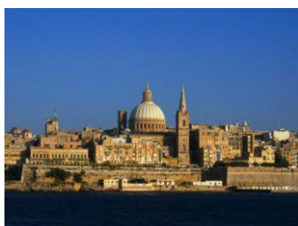
La Valette vue de Sliema