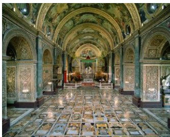
Co-cathédrale St Jean