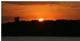
Arrivée en soirée...

En milieu d'après-midi, accueil et enregistrement à l'aéroport de Zurich, puis vol à destination de Malte, où nous arriverons en début de soirée.