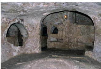
Catacombes St Paul