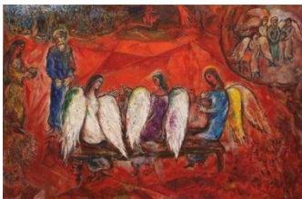
Musée Chagall, Abraham et les trois anges