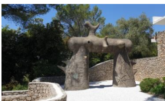
A la Fondation Maeght

Une journée hors du commun s'offre à nous, partagée entre la découverte de Marc Chagall et la visite de la superbe fondation Maeght.