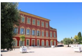
Nice, musée Matisse