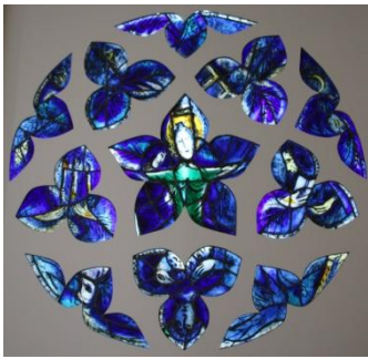
Musée Chagall, vitrail, détail