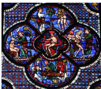
Vitrail de la création