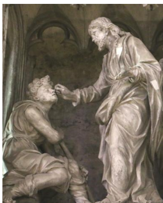
Tour de chœur : Jésus guérit l'aveugle