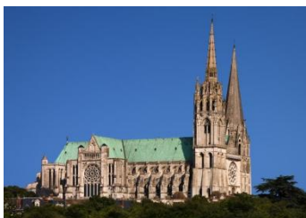
La cathédrale de Chartres

Départ de divers lieux (rendez-vous fixés en fonction du domicile des participants) en car tout confort (WC, lavabo, air conditionné, frigo, DVD...). Le trajet sera rythmé par des apports qui nous introduiront à la construction des grandes cathédrales gothiques et, plus spécifiquement, à cette magnifique cathédrale.