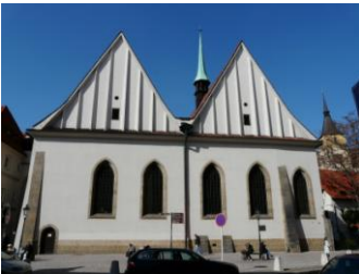
Chapelle de Bethléem

Ce matin, nous débuterons par un petit tour du centre ville pour prendre nos repères et voir la fameuse horloge astronomique, la place du marché et, en son centre, l'immense statue célébrant Hus.