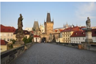
Sur le pont Charles