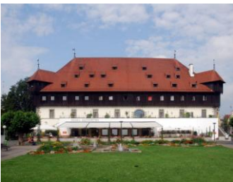
Constance, bâtiment du concile

Une heure de route nous suffiront ce matin pour rejoindre Constance, très jolie ville au bord du lac du même nom, siège du fameux concile qui condamna Hus en pleine crise de la papauté (papes à Avignon et à Rome). Nous y visiterons quelques lieux-clé, dont le musée qui lui est dédié, terminant ainsi notre voyage chronologiquement par le lieu où il est mort.