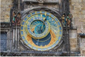
Horloge astronomique (vue partielle)