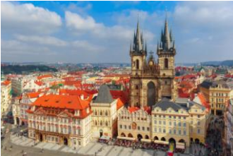
Place du marché et église du Tyn