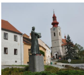
Husinec, statue de Hus

Il ne nous faudra qu'une heure ce matin pour arriver à Husinec, ville natale de Jean Hus. Nous y visiterons le musée qui lui est dédié, et nous aurons aussi un œil pour sa statue et une maison décorée avec des grandes figures de l'histoire des hussites.