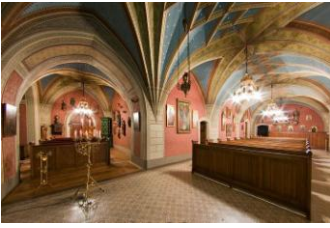
Konopiste, chapelle du château

et impressionnants châteaux. Celui de Konopiste comprend également un grand parc où nous pourrons nous balader selon le temps qu'il fera.