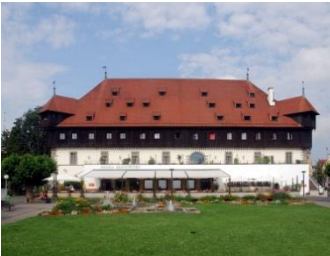
Constance, bâtiment du concile

Une heure de route nous suffiront ce matin pour rejoindre Constance, très jolie ville au bord du lac du même nom, siège du fameux concile qui condamna Hus en pleine crise de la papauté (papes à Avignon et à Rome). Nous y visiterons quelques lieux-clés, dont le musée qui lui est dédié, terminant ainsi notre voyage chronologiquement, par le lieu où il est mort.