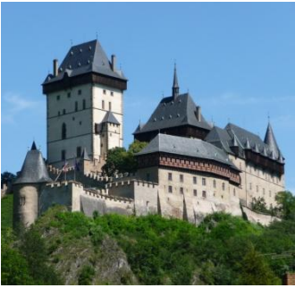
Château de Karlstejn

Quittant Prague, nous nous rendrons au splendide château de Karlstejn, bijou de l'architecture fortifiée gothique et l'un des plus importants de Bohême. L'Empereur Venceslas I er y fit abriter les joyaux de la couronne pour les protéger durant les guerres hussites. Nous y bénéficierons d'une riche visite guidée puis d'un temps libre pour le repas.