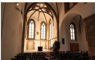
Eglise St Martin

Ensuite, une visite guidée nous emmènera vers les haut-lieux liés à la Réforme hussite. Nous débuterons par la chapelle de Bethléem, destinée à l'époque aux célébrations en langue tchèque, et son petit musée contigu, dédié au préréformateur.