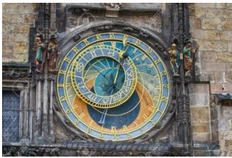
Horloge astronomique (vue partielle)

pour trois nuits dans le Charles Bridge Palace****, idéalement placé au plein centre près du fameux pont Charles.