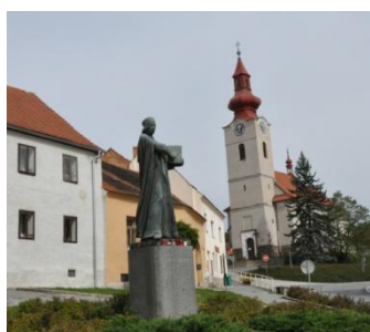
Husinec, statue de Hus

Il ne nous faudra qu'une heure ce matin pour arriver à Husinec, ville natale de Jean Hus. Nous y visiterons le musée qui lui est dédié, et nous aurons aussi un œil pour sa statue et une maison décorée avec des grandes figures de l'histoire des hussites.