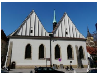
Chapelle de Bethléem

Poursuivant nos découvertes, nous nous arrêterons, entre autres, devant le Carolinum. Cette université a été importante dans l'histoire de Hus et des hussites, puisque Hus y a enseigné et en est devenu recteur. Après sa mort, les maîtres de cette université participèrent, en 1420, à la proclamation des « Quatre articles de Prague » qui entérinaient la réforme hussite.