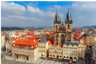
Place du marché et église du Tyn

Ce matin, après un temps libre, nous aurons le privilège d'une rencontre avec des responsables de l'Eglise des Frères tchèques, puis nous mangerons avec eux.