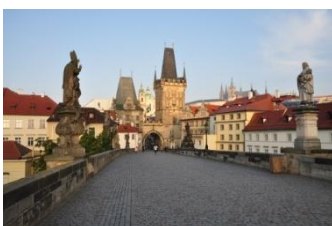
Sur le pont Charles

Ce matin, une jolie balade nous fera découvrir et traverser la Vltava (connue aussi sous son nom allemand de Moldau) par le fameux pont Charles, traverser le beau quartier de Mala Strana et monter vers la colline du château et de la cathédrale.