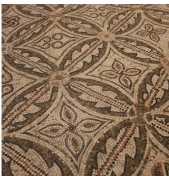
Abbaye de Pomposa, pavement

Si Ravenne aura été un grand moment de notre voyage, la suite n'aura pas grand-chose à lui envier ! Ce matin, nous nous rendrons à 50 kilomètres au nord de Ravenne à la découverte de l'abbaye romane de Pomposa , consacrée au XI ème siècle. Nous quitterons ainsi le monde des mosaïques pour celui des fresques et l'abbatiale de Pomposa nous proposera un programme exceptionnel avec un intérieur entièrement peint de scènes en grand partie bibliques. Le pavement est également magnifique. Nous nous laisserons guider dans ces lieux avant de prendre le repas sur place.