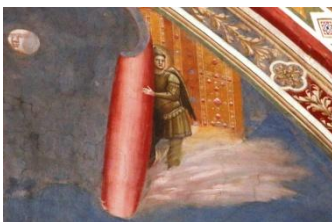
Chapelle des Scrovegni, un ange ouvre le ciel et dévoile la Jérusalem céleste...

Une journée complète à Padoue s'ouvre à nous.