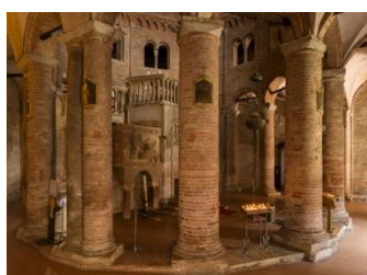
Bologne, San Stefano St Sépulcre

En toute fin d'après-midi, nous retrouverons notre car pour rallier notre hôtel*** qui se situera en dehors de ville, en direction de Ravenne, où nous mangerons également.