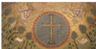
Sant'Appolinare in Classe

Aujourd'hui, départ pour Ravenne qui a été capitale de l'Empire d'Occident, ce qui nous vaut aujourd'hui les splendeurs que nous découvrirons durant deux jours !