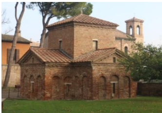
Le mausolée Galla Placidia, un extérieur qui ne paie pas de mine...