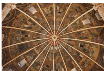
Parme, plafond peint du baptistère

Départ de divers lieux de Suisse romande (fixés en fonction du domicile des participants) pour l'Italie via le Grand-Saint-Bernard. Durant le trajet, des apports seront faits et des documents distribués pour nous préparer à ce que nous allons découvrir durant la semaine. Quelques arrêts en cours de route dont un pour le repas de midi.