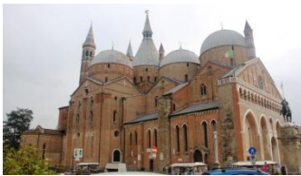
Basilique St Antoine