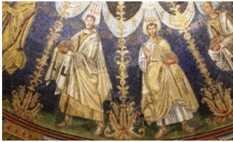
Baptistère néonien, détail