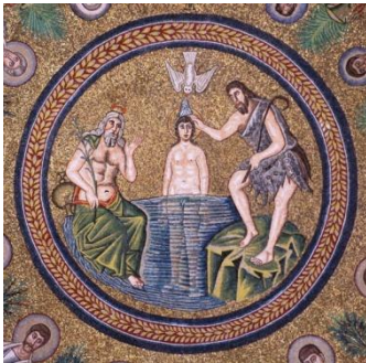
Baptistère des Ariens, centre de la coupole

Nous rejoindrons notre hôtel*** au centre de Ravenne pour y déposer nos bagages et nous profiterons d'un temps libre pour le repas de midi.