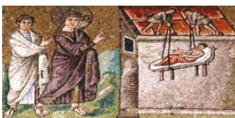
Ravenna, à Sant' Appolinare Nuovo

Cette journée sera celle du retour en Suisse après une semaine très riche dans ces magnifiques lieux d'Italie du Nord !