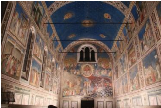
La chapelle des Scrovegni