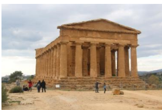
Agrigente, dans la vallée des temples

Un repas libre suivra sur le site, avant de poursuivre en direction d'Agrigente où nous arriverons en milieu d'après-midi.