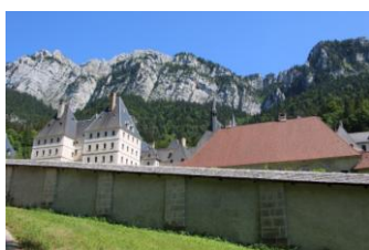
La Grande Chartreuse

C'est le massif de la Chartreuse qui nous accueillera aujourd'hui.