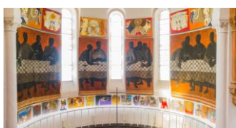
Musée Arcabas, chœur