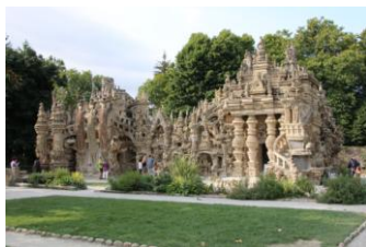
Palais du facteur Cheval