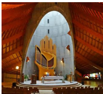
Eglise de l'Alpe d'Huez