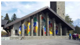
Eglise du plateau d'Assy