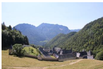
La Grande Chartreuse