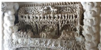
Palais Idéal du facteur Cheval, détail