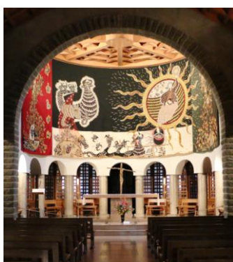
Eglise du plateau d'Assy, chœur

Départ de divers lieux (rendez-vous fixés en fonction des domiciles des participants) dans un car tout confort (WC, air conditionné, frigo, DVD...)