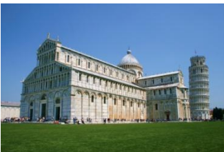
Pise, place des miracles

Après un copieux petit déjeuner buffet, nous nous déplacerons à Pise et plus précisément à la fameuse « place des miracles » composée du baptistère, de la cathédrale, du cimetière (Campo Santo) et du campanile (la fameuse tour penchée). Cette place est d'une beauté et d'une harmonie exceptionnelle. Notre visite guidée commencera par le baptistère (13 ème siècle) avec en particulier ses fonds baptismaux et sa magnifique chaire, se poursuivra avec la cathédrale (débutée en 1063), avec ses portes, la mosaïque de l'abside et sa chaire, et se conclura par le Campo Santo (cimetière, commencé en 1278) avec ses multiples fresques, dont la fameuse série du « triomphe de la Mort », du « jugement dernier » et de « l'enfer ».