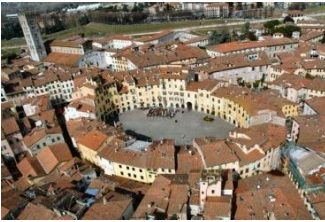
Lucca, place de l'amphithéâtre

Départ de divers lieux (fixés en fonction des domiciles des participant.e.s) pour la Toscane via le tunnel du Grand Saint Bernard et Gènes, dans un car tout confort (WC, lavabo, air conditionné, frigo, DVD...).