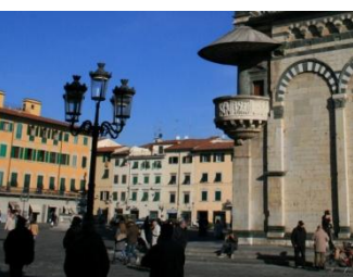
Cathédrale de Prato, chaire

Après le petit déjeuner, nous prendrons la route de Prato, à quelques kilomètres de Florence. La cathédrale Saint-Etienne a une particularité : une chaire à l'extérieur de l'église ! Cette chaire est destinée à présenter la Sainte Ceinture à la population (nous en découvrirons l'histoire). A l'intérieur, de splendides fresques ornent les absides du chœur.