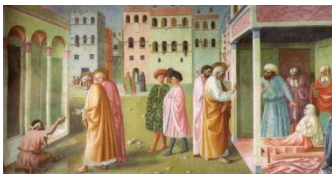
Chapelle Brancacci, fresque

Nous nous rendrons ensuite à pied au baptistère qui se trouve devant le dôme de Florence pour y admirer et détailler les somptueuses mosaïques sur fond d'or qui composent son immense voûte (25 mètres de diamètre !).