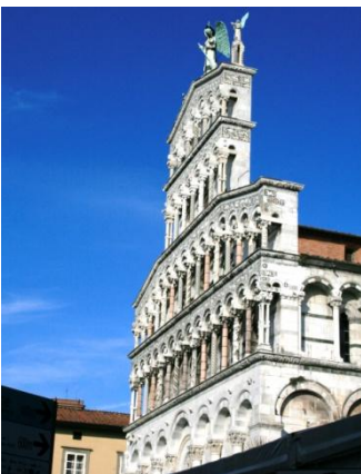
Lucques, église St Michel, façade

Vers 15h, nous quitterons Pise pour retourner à Lucques, située à une demi-heure de route, une belle ville ceinte d'une muraille importante. Nous y visiterons ensemble la cathédrale puis, librement, chacun pourra flâner dans les ruelles découvrant de multiples richesses, en particulier les églises saint Michel et Saint Jean (avec les restes archéologique du baptistère et de constructions antérieures, dont romaines), la tour Guinigi, la très belle place de l'amphithéâtre et les murailles ! Nous retrouverons notre hôtel**** pour le repas et la nuit.