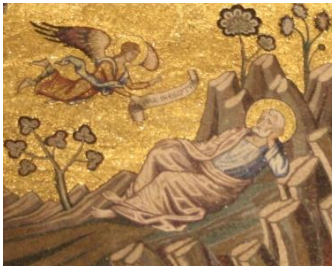
Florence, baptistère, rêve de Joseph (détail de la mosaïque)

Dernière grande étape de notre voyage : Florence ! Le choix de ce voyage est d'y cibler trois lieux phares et, en une journée, de renoncer à tout le reste... Florence reste en effet facilement accessible en train depuis la Suisse.