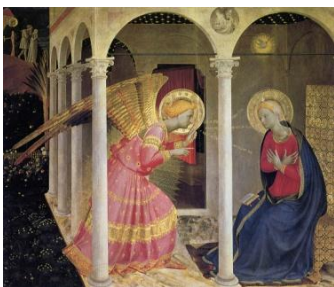
Cortona, musée diocésain, Annonciation

Cette journée nous amènera aux magnifiques villes d'Arezzo et de Cortona.