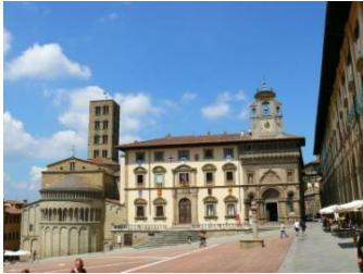
Arezzo, Piazza Grande