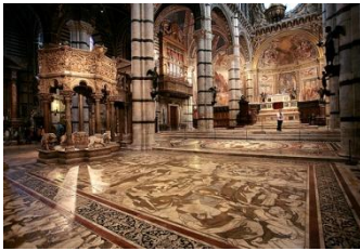
Siene, intérieur de la cathédrale

découverte sous la cathédrale de manière fortuite il y a à peine vingt ans ! Elle recèle de très belles fresques du 13 ème siècle que nous découvrirons également !