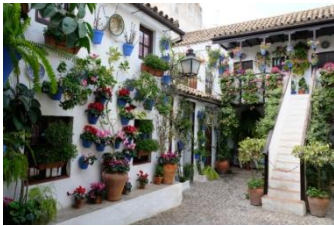
Patio de palais andalous