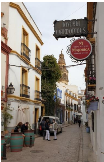
Les belles ruelles bordées de maisons blanches

Un nouveau temps libre pour poursuivre des découvertes individuelles s'ouvrira et nous nous retrouverons en soirée pour le repas et la nuit à l'hôtel**** NH Amistad de Cordoba.