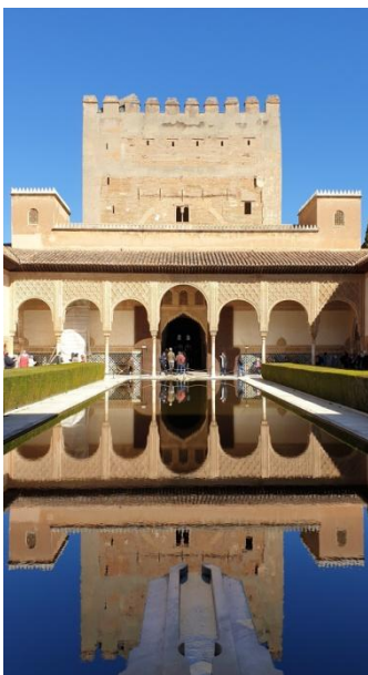
Alhambra, palais nasrides

C'est à l'Alhambra que nous monterons ce matin. Ce somptueux ensemble de palais méritera que nous y consacrons une grande partie de la journée.