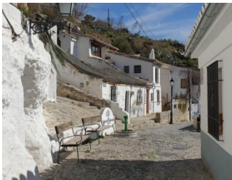
Chemin faisant, en haut de l'Albayzín...