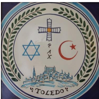
Tolède, ville de coexistence des trois religions