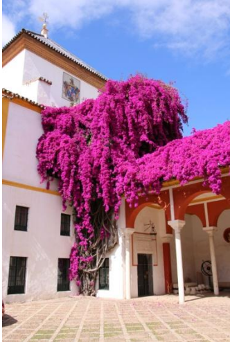
Palais de Pilate

Arrivant en fin de voyage, il y aura plus de temps libre durant ces deux dernières journées, après une grosse visite commune en matinée.