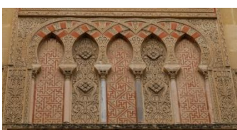
Mosquée-cathédrale détail extérieur

Nous prendrons nos quartiers pour trois nuit à l'hôtel*** Inglaterra, à nouveau idéalement situé en plein centre historique. Le repas se prendra dans un restaurant tout proche.