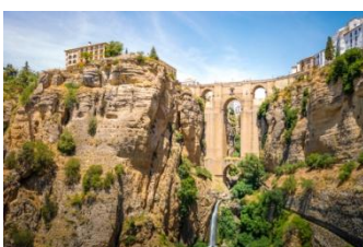
Ronda, sa gorge et son pont

Nous partirons pour Séville ce matin, en faisant une étape magnifique : la ville de Ronda. Cette ville au patrimoine architectural d'une richesse fabuleuse, se trouve sur un site exceptionnel qui domine la gorge vertigineuse du Tajo, d'une profondeur de plus de 100m.