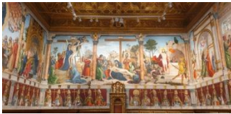
Tolède, cathédrale, salle capitulaire

En toute fin de matinée, accueil et enregistrement à l'aéroport de Genève, puis vol à destination de Madrid.