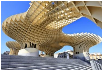
Séville, le Metropol Parasol

En deuxième partie d'après-midi, nous reprendrons la route pour rallier la dernière étape de notre voyage ; la grande ville de Séville !