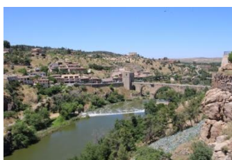
Vue depuis la ville

Nous nous retrouverons à notre hôtel*** pour le repas et la nuit.