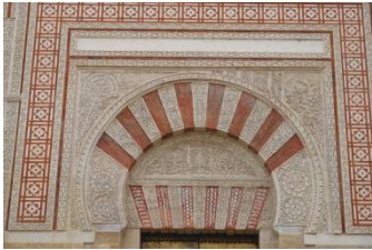
Mosquée-cathédrale, l'un des portails latéraux

cela laisse déjà imaginer la splendeur de cet ensemble. Quant au musée, il présente de manière très didactique l'histoire du califat et nous laisse voir de multiples chapiteaux et autres objets issus du site.