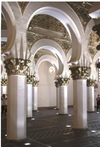
Synagogue Maria la Blanca

Nous débiterons cette journée par une visite guidée de la ville. Si nous commençons notre voyage par Tolède, qui n'est pas en Andalousie, c'est parce qu'elle était la capitale du royaume wisigoth au moment de l'invasion musulmane et qu'elle est restée, tant bien que mal, un lieu de référence du christianisme tout au cours de la période musulmane.