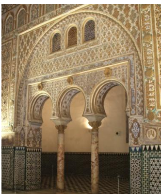
Dans l'Alcazar royal

Nous débuterons cette dernière journée à Séville par le magnifique Alcazar, ce château royal d'une grande diversité architecturale. Commencé au 10 ème siècle, il sera complété au fil des siècles. Nous y admirerons entre autres les arcs fortifiés almohades, le palais gothique – chef d'œuvre de l'art mudéjar, inspiré par les palais de l'Alhambra – et les magnifiques jardins.