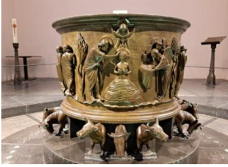
St Barthélemy, fonts baptismaux

fonte, ils représentent un travail exceptionnel pour l'époque. Nous commencerons par un film explicatif du contexte de cette œuvre, puis nous la détaillerons. Dans un deuxième temps, nous devrions pouvoir visiter le carillon et l'orgue de l'église.