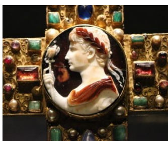
croix de Lothaire (cœur)

Après le long trajet en car de l'aller, c'est une journée consacrée au centre ville d'Aix-la-Chapelle qui nous attend.