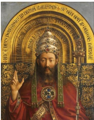
Retable de l'Agneau mystique, détail

Au cœur de Gand se trouve la cathédrale St Bavon (anciennement église St Jean). Pour elle, Hubert van Eyck, puis après sa mort son frère Jan, a peint le retable appelé « adoration de l'agneau mystique ». Commandé par le riche marguillier de l'église, il a été placé sur l'autel en 1432, après plusieurs années de réalisation, et est une œuvre majeure et charnière de l'art occidental. Nous aurons déjà abordé sa riche symbolique lors de l'un de nos trajets en car et là, il sera temps de le voir en vrai.