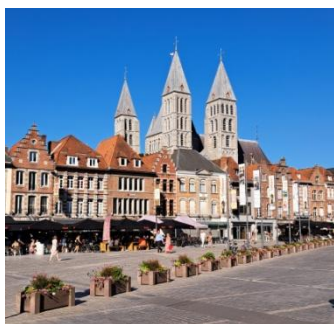
Tournai, la cathédrale vue de la Grand Place