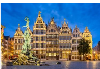
Anvers, la Grand Place