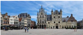
Malines, place du marché

Aujourd'hui, nous quittons Liège pour rejoindre, tout d'abord, la ville de Mons, au sud du pays. Là se trouve un beau beffroi qui a l'avantage d'être équipé d'un ascenseur moderne ! Nous le visiterons et entrerons ainsi dans le monde des beffrois et des carillons, une spécificité du nord de la France et du Benelux.