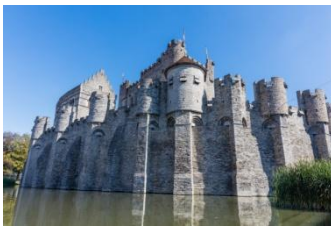
Le château des comtes

Quittant Anvers, c'est vers Gand que nous nous dirigeons ce matin pour deux nouvelles riches journées.