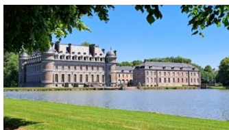
Le château de Belœil

Quittant Gand en tout début de matinée, nous rejoindrons Tournai, belle ville du sud de la Belgique et première capitale du royaume franc.