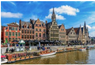
Le superbe centre historique