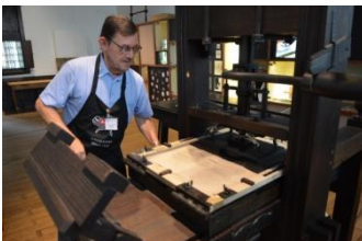
Musée Plantin-Moretus, imprimeur à l'œuvre