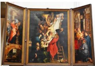
Cathédrale, retable de Rubens

Anvers est une ville de grand intérêt. Non seulement elle recèle de magnifiques musées, églises et bâtiments, mais elle est aussi l'un des importants ports qui ouvrent l'Europe à l'Atlantique et au-delà. Nos deux journées dans cette ville conjugueront ces deux aspects, tout en laissant du temps libre pour des découvertes individuelles.