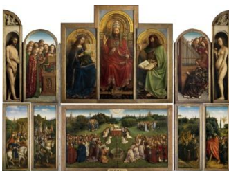
Retable de l'Agneau mystique