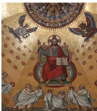
Cathédrale, détail des mosaïques