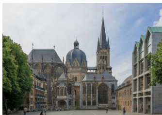
Aix-la-Chapelle, l'étonnante cathédrale

Départ de Suisse romande (lieux de départ fixés en fonction du domicile des participants) pour Aix-la-Chapelle.