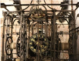
Mons, beffroi, mécanisme de l'horloge