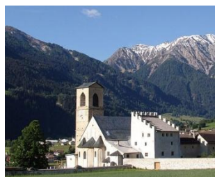
Monastère de Mustair

Départ de divers lieux pour les Grisons, via Zurich, dans un car tout confort (WC, lavabo, air conditionné, frigo, ...).