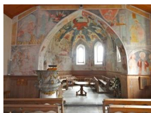
Eglise de Lavin

Après un déjeuner buffet copieux, nous traverserons le Parc National pour atteindre l'Ofenpass (2149 m) puis redescendre en direction de Müstair, l'un des endroits les plus retirés de Suisse, mais ouvert sur l'Italie. Là, nous découvrirons l'Eglise du monastère St Jean, l'un des trois premiers monuments suisses à figurer au patrimoine mondial de l'UNESCO. Nous profiterons d'une visite guidée pour le musée et l'église qui recèle des peintures murales du 9 ème siècle et du 12 ème siècle.