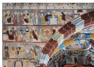
Eglise de Rhäzuns

Puis, pour conclure notre parcours grison, nous irons, par une petite balade à pied de quinze minutes, visiter l'église St Georges de Rhäzuns, une église du 12 ème siècle, recouverte d'impressionnantes scènes bibliques. Nous pourrons les découvrir à notre rythme grâce à des plans explicatifs.