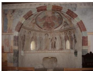
Chapelle de Clugin

Encore une magnifique journée en perspective! Nous commencerons par nous rendre à Zillis pour y visiter la fameuse église dont le plafond est constitué de 153 panneaux représentant, entre autres, de multiples épisodes de la vie du Christ. Nous visiterons également le musée dédié à cette église. Le repas se prendra librement dans le village.