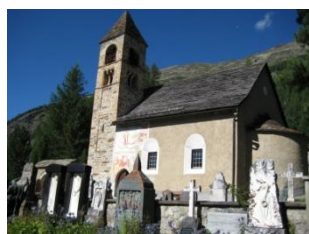
Sta Maria, Pontresina