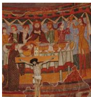
Présentation de la tête de Jean-Baptiste, Mustair