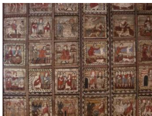
Plafond de l'église, Zillis