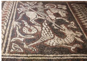
Ganagobie, détail de l'extraordinaire pavement

Départ de divers lieux (rendez-vous fixés selon les domiciles des participants) dans un car tout confort (WC, air conditionné...). Dans le car, diverses informations seront données pour nous permettre d'entrer dans le sujet de cette belle semaine.