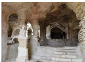
Saint-Roman, la chapelle troglodytique

En début d'après-midi, nous poursuivrons notre route vers l'ouest de la Provence pour aller découvrir une abbaye très différente : l'abbaye troglodytique de St-Roman. Très étonnante et unique de ce type en Europe occidentale, elle se situe sur un promontoire rocheux en pleine nature. Nous en découvrirons la chapelle, le cellier, les cellules et sa nécropole rupestre. Sa filiation spirituelle avec les moines de l'Orient chrétien et son aspect primitif nous évoquera les monastères d'Égypte ou de Capadoce.