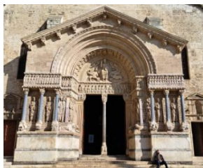
St Trophime, portail