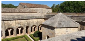
Le Thoronet, cloître