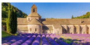
Abbaye de Sénanque