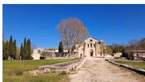
Abbaye de Silvacane

Place ce matin à la deuxième des trois sœurs cisterciennes de Provence : Silvacane. Signifiant « forêt de roseaux », son nom fait référence aux marécages présents sur le site. Splendide par son élan et sa simplicité, elle nous ouvrira ses portes pour une visite qui nous permettra d'en apprécier la beauté et les spécificités, dont l'appartement du prieur situé à part, contrairement aux règles cisterciennes.