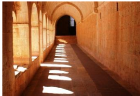
Le Thoronet, chemin de lumière...

Après un bon petit déjeuner, nous rejoindrons l'une des trois fameuses abbayes cisterciennes de Provence : celle du Thoronet. Les cisterciens étant un ordre contemplatif, ils construisaient leurs abbayes dans des lieux retirés, en pleine nature. Le Thoronet n'échappe pas à la règle et c'est au cœur des bois que nous la découvrirons. Une visite guidée nous en révélera de multiples et riches aspects.