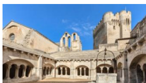
Abbaye de Montmajour

Peu de kilomètres aujourd'hui, puisque nous nous rendons à Arles pour visiter l'église St-Trophime, ou plus précisément son splendide portail et les magnifiques chapiteaux de son cloître. Une présentation détaillée de son portail et de quelques chapiteaux nous éclairera sur le programme spirituel qui a été mis en œuvre autour de cette ancienne cathédrale.