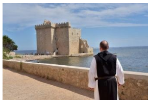
Monastère de Lérins, la tour fortifiée

Aujourd'hui, nous prenons l'air du large !