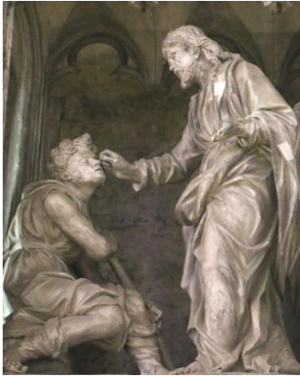
Tour de chœur : Jésus guérit l'aveugle