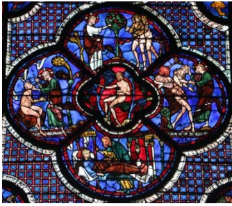
Vitrail de la création