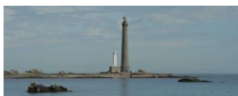
Bienvenue au Finistère !

En deuxième partie de matinée, départ en car de Suisse romande (lieux de départ fixés en fonction du domicile des participants) pour l'aéroport de Lyon où nous bénéficierons, en milieu d'après-midi, d'un vol direct pour Brest. Ce sera un grand confort de n'avoir qu'un vol, d'éviter Paris et de bénéficier d'un départ en car de Suisse romande.