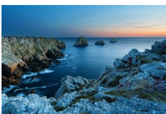
La pointe de Penhir au coucher du soleil...

Nous rentrerons alors à notre hôtel**** pour le repas du soir et la nuit.