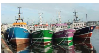
Guilvinec, port de pêche

Aujourd'hui, c'est dimanche, jour du culte... et aussi du marché !