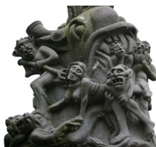
Guimiliau, l'enfer, détail du calvaire

En milieu d'après-midi, notre car nous ramènera à Roscoff où nous irons découvrir l'église Notre-Dame, intéressante par l'importance que revêtent la mer, les bateaux et les marins. En effet, plusieurs bateaux sont représentés, en sculpture ou en maquette, qui sont autant d'exvotos pour