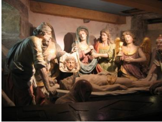
St Thégonnec, mise au tombeau du Christ

Après le petit déjeuner, nous quitterons Roscoff avec nos bagages et un pique-nique. Première étape de la journée : l'enclos paroissial de St-Thégonnec, l'un des monuments les plus visités du Finistère, dont une très belle mise au tombeau du Christ, avec des personnages grandeur nature.