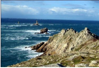
La Pointe du Raz