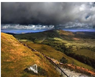
Le Roc Trévél

Un temps libre suivra, avant le repas, pour se reposer, pour profiter de la piscine ou partager l'apéritif !