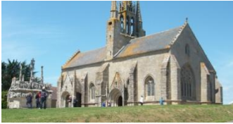
Tronoën, église et calvaire

Quimper, dans ce deuxième lieu de culte de la paroisse. Les personnes qui ne voudraient n'aller qu'au marché pourront le faire bien sûr.