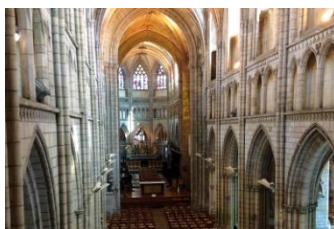
St Pol de Léon, cathédrale

Nous retrouverons ensuite Roscoff et notre hôtel*** pour un temps libre, le repas du soir et la nuit.