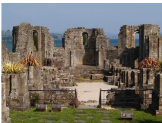
Landevennec, ruines de l'abbatiale

Ce matin, nous irons vers l'un des plus anciens haut-lieux spirituels chrétien de Bretagne : l'ancien monastère de Landevennec dont l'origine remonte autour de l'an 500. Durant plusieurs siècles, les moines y ont vécu selon la règle de St Colomban, moine irlandais. De ce fait Landevennec a vécu longtemps un « christianisme celtique », à savoir développé hors de la tutelle romaine. Nous en découvrirons des facettes très intéressantes. Si le site est constitué de ruines - le monastère millénaire ayant dû fermer à la Révolution - le musée est moderne et passionnant.