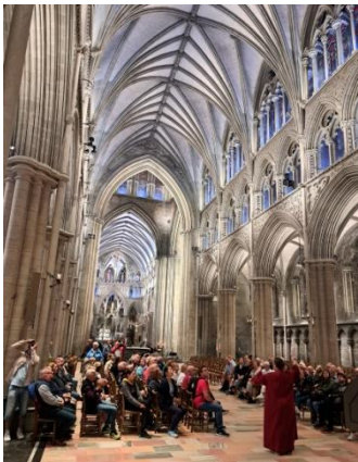
... et sa splendide nef

Ce matin, c'est la visite de la cathédrale de Nidaros (ancien nom de Trondheim) et des musées attenants qui est au programme. Construite à l'emplacement de la tombe du roi Olav, tué à la bataille de Stiklestad en 1050, la cathédrale est gothique, même si de nombreuses statues de la façade datent de sa reconstruction au XIX ème siècle. Deuxième plus grande église de Scandinavie, elle est aussi la cathédrale médiévale la plus septentrionale du monde. Tout récemment rénovée, elle est splendide autant à l'intérieur qu'à l'extérieur. Une visite guidée nous en présentera l'histoire et la richesse. Nous découvrirons aussi l'importance du pèlerinage de St Olav pour lequel, à fin juillet, des pèlerins convergent vers Trondheim après des centaines de kilomètres à pied.