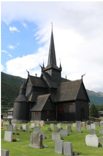
Eglise de Lom

Si la journée d'hier nous aura impressionné.e.s par ses routes côtières, ce seront aujourd'hui les routes de montagne qui vont nous ébahir, tant elles n'ont rien à envier à nos routes de montagne suisses.