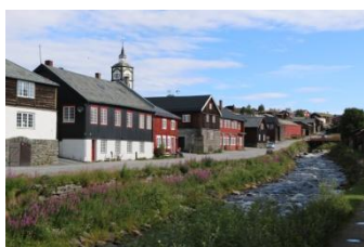
La charmante ville de Røros