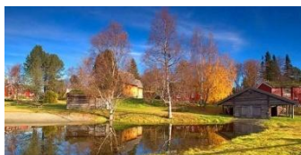
Musée de Sverresborg

Quittant Røros, nous traverserons de magnifiques paysages où il n'est pas exclu de croiser des rennes !