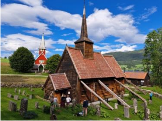
Eglise de Rødven

Passant ensuite près de Molde, nous emprunterons un nouveau tunnel sous un fjord, prendrons un ferry et rejoindrons la seconde église en bois debout de la journée, celle de Rødven, que nous visiterons. Un peu plus récente que la plupart des autres, elle remonte au XIV ème siècle.