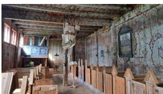
Eglise de Kvernes