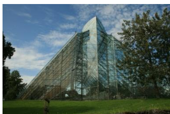
Hamar, cathédrale de verre