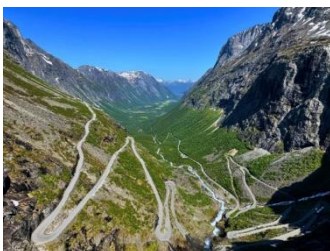
Route du Trollstigen

Quittant notre hôtel en tout début de matinée, il nous faudra un peu moins de quatre heures pour rejoindre l'aéroport d'Oslo après neuf jours inoubliables et d'une grande diversité.