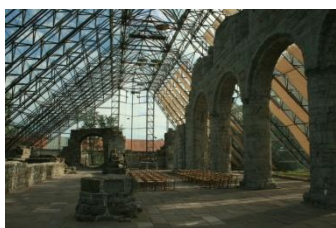
Les ruines abritées

Ce matin, nous prendrons la route direction Hamar où se trouvent les ruines d'une cathédrale construite dans la deuxième partie du XII ème siècle, d'abord en style roman puis gothique. Détruite en 1567 par les Suédois durant la guerre nordique de Sept ans, ses ruines ont été mises sous une nouvelle église de verre en 1987 afin de les préserver. Cette nouvelle structure, très originale, permet à nouveau la tenue de cultes et de concerts.