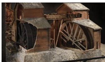
Musée des mines, maquette

Røros est l'une des plus anciennes villes d'Europe construites en bois. Aujourd'hui, la plupart des maisons du centre historique datent des XVII ème et XVIII ème siècles. Nous avons une journée entière pour la visite de cette charmante petite cité minière, classée au patrimoine mondial de l'UNESCO.