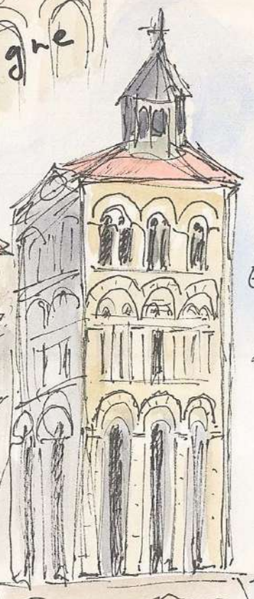
Eglise abbatiale St Léger d'Ebreuil