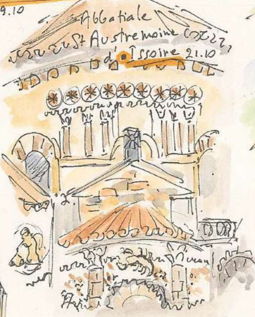
Abbatiale St Austremonne Issoire 21.10