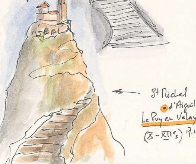
St Michel d'Aiguille Le Puy en Velay (X-XII es ) 17.10