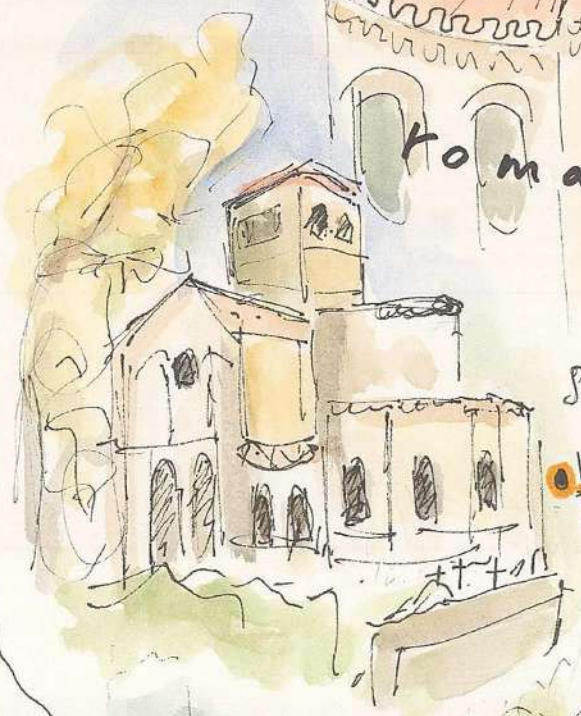
Ste Croix de Veaux 16.10

② 17.10 "Entre nous, et l'enfer et le ciel, il n'y a que la vie entre 2, qui est la chose du monde la plus fragile"