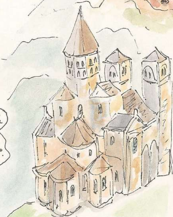
Eglise de St Nectaire 18.10