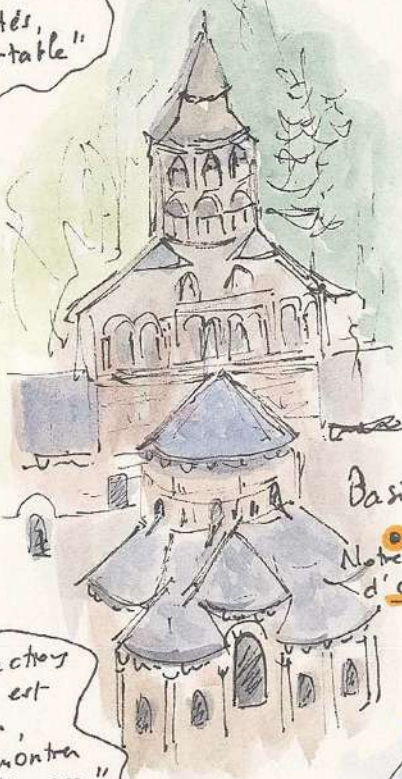
Basilique Notre Dame d'Orcival 18.10