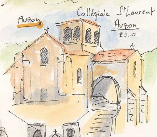
Avzon Collégiale St Laurent Avzon 20.10