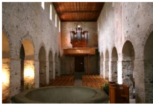
Sobriété à Amsoldingen