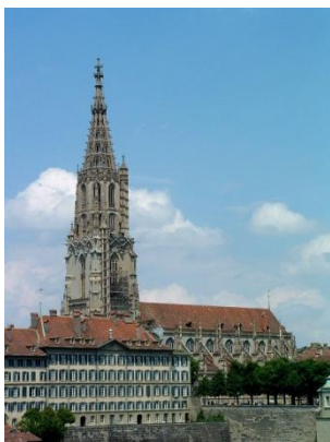
Collégiale de Berne

Aujourd'hui, nous quittons ce manteau de petites églises de l'Oberland pour rejoindre Berne, où nous changerons de contexte et de dimensions avec cette belle et grande église gothique qu'est la collégiale de Berne (l'on ne peut parler de cathédrale, aucun évêque n'ayant jamais eu de siège à Berne). Nous nous laisserons guider dans la visite autant extérieure, en particulier le magnifique portail, qu'intérieure.