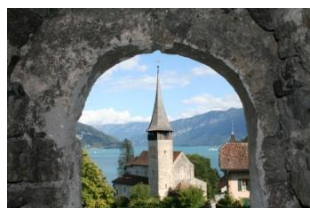
Spiez, l'église et le lac vus du château

Nous commencerons la journée par la visite de l'église d'Erlenbach, un vrai bijou, typique des églises de l'Oberland bernois, l'une des plus riches en peintures murales de notre voyage. Un petit concert (encore à confirmer) nous permettra peut-être d'en découvrir l'orgue.