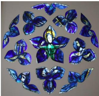
Musée Chagall, vitrail, détail