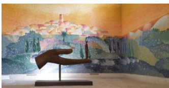
St-Paul-de-Vence, chapelle des Pénitents Blancs

C'est à Marc Chagall que nous consacrerons une grande partie de la journée ce vendredi !