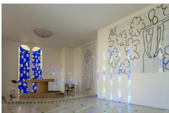
Vence, chapelle du Rosaire