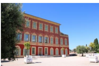
Nice, musée Matisse