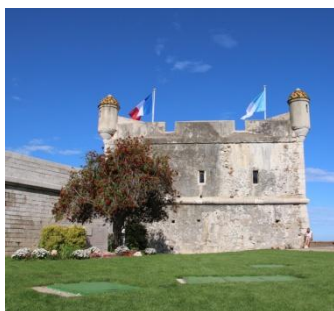
Menton, musée des Bastions

Départ de divers lieux de Suisse romande (lieux fixés en fonction du domicile des participants) pour l'Italie via le tunnel du Grand-Saint-Bernard. C'est en effet une boucle que nous entamerons, descendant par l'Italie et le tunnel de Tende puis remontant en fin de voyage par la vallée du Rhône.