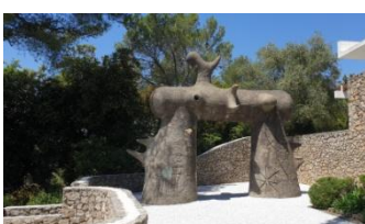
A la Fondation Maeght

Une journée hors du commun s'offre à nous, partagée entre la découverte d' Henri Matisse et la visite de la superbe fondation Maeght.