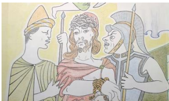
Chapelle ND de Jérusalem, arrestation de Jésus

En cette dernière journée sur place, c'est Pablo Picasso qui sera à l'honneur !