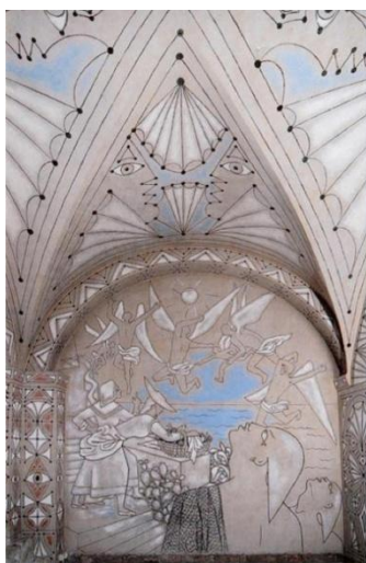
Villefranche-sur-Mer, chapelle St Pierre

Cette journée sera consacrée à la découverte de Jean Cocteau à Menton et à Villefranche-sur-Mer.