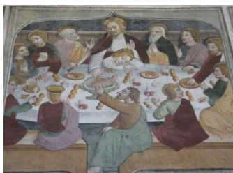
La Brigue, chapelle ND des Fontaines, la Cène