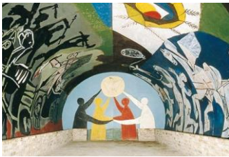
Vallauris, chapelle Guerre et Paix