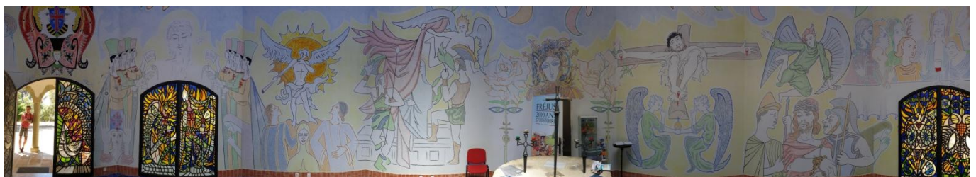
Chapelle Notre Dame de Jérusalem, peinte par Cocteau, vue panoramique

NB: Des changements de programme sont possibles. Cependant, le maximum sera fait pour pouvoir visiter l'ensemble des lieux prévus.