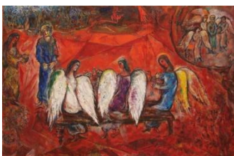
Musée Chagall, Abraham et les trois anges