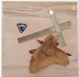
Courtételle, une station du chemin de croix