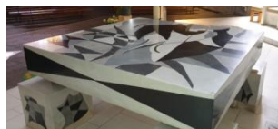
Moutier, ND de la Prévôté, autel

Pour débiter le dernier jour de notre riche périple jurassien : Moutier !