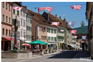
Delémont, vieille ville

Aujourd'hui, nous resterons dans la région de Delémont, en commençant par nous rendre à l'église de Courfaivre. Elle est la deuxième des églises jurassiennes à avoir intégré l'art moderne, cela grâce à Jeanne Bueche, première femme diplômée en architecture en Suisse romande. Elle a de suite vu grand, puisque les vitraux sont de Fernand Léger.