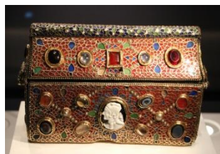
St Maurice, reliquaire

Départ de divers lieux fixés en fonction du domicile des participants dans un car confortable (WC, air conditionné...) en direction du Valais.