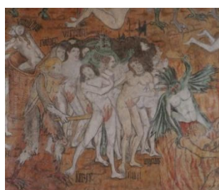
Rarogne, église historique, détail

Dans l'histoire du Valais, les dizains (districts d'aujourd'hui) et les nobles du Haut-Valais ont joué un rôle très important. Rarogne en fait partie. Nous commencerons donc la journée par une visite guidée de ce village, de son musée et de ses deux églises, l'une historique au haut du rocher et l'autre creusée dans le même rocher en 1974 pour éviter aux paroissiens la rude montée ! Près de l'église historique, où nous vivrons un temps de recueillement, se trouve la tombe du poète Rilke dont les écrits enrichiront nos journées durant toute la semaine.