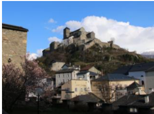
La colline de Valère

C'est le chef lieu valaisan, riche de 7000 ans d'histoire, qui nous accueille aujourd'hui. Grâce à une visite guidée, nous découvrirons des lieux inédits, certains inaccessibles en temps normal : les thermes romains, la tour des sorciers, la maison Supersaxo (appartenant à l'un des hommes qui a marqué l'histoire du Valais, ami puis ennemi juré de l'évêque Schiner...), la cathédrale, l'hôtel de ville avec la première inscription chrétienne de Suisse.