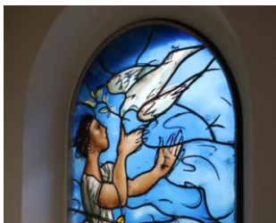
Martigny, chapelle protestante

Durant cette petite semaine, nous aurons traversé l'histoire du Valais qui nous sera d'ailleurs racontée et expliquée dans le car lors de riches exposés.