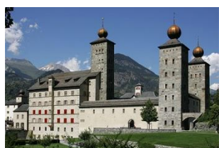
Brigue, château Stockalper

En fin de matinée, nous rejoindrons Loèche où nous aurons un temps de repas libre avant de visiter l'église paroissiale et son impressionnant ossuaire. Nous rejoindrons ensuite la chapelle baroque Ringacker, en bas du village, où nous attendra notre organiste, pour un petit concert.