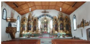
Ernen, riche intérieur