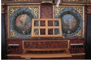
Biel, console de l'orgue