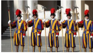
Les fameux gardes suisses

Nous rejoindrons alors Biel, dont l'église comporte une magnifique petit orgue avec des volets peints de scènes bibliques. Nous y vivrons un temps de recueillement « parole et musique ».