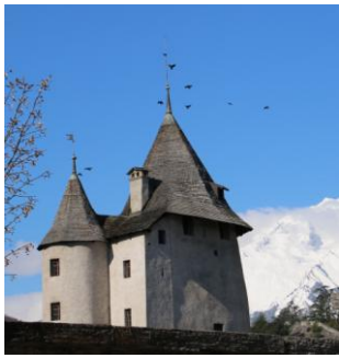
Sion, tour des sorciers...