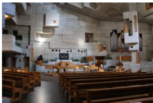
Hérémenche, une réussite !