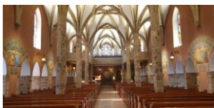
Savièse, harmonie et équilibre