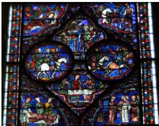
Détail d'un vitrail