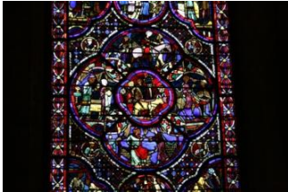
Détail d'un vitrail, cathédrale, Bourges

Après le petit-déjeuner, nous voici partis pour une journée tout entière consacrée à la cathédrale de Bourges, qui n'a pas grand chose à envier à sa sœur de Chartres !