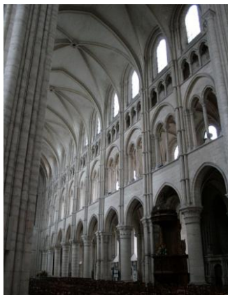
Nef, cathédrale, Laon

Après approximativement deux heures de route durant lesquelles un DVD sur la cathédrale d'Amiens sera visionné, nous arriverons à notre hôtel**** Mercure Cathédrale, au cœur de la ville.