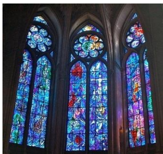
Vitraux de Chagall, cathédrale, Reims

Départ de divers lieux pour la France (rendez-vous fixés en fonction du domicile des participants) dans un car tout confort (WC, lavabo, air conditionné, frigo, boissons, ...). Dans le car, des apports seront faits pour nous préparer à ce que nous allons découvrir durant la semaine et rythmer ainsi le trajet. Quelques arrêts en route, dont un pour le repas de midi.