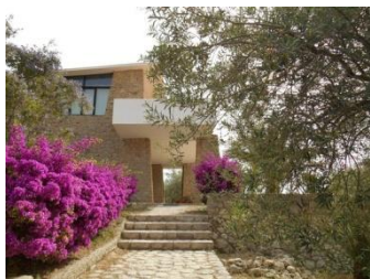
Riesi, centre d'accueil de l'Eglise Vaudoise