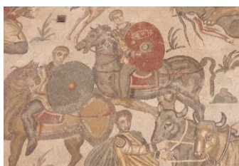
Villa Romana di Casale, détails d'une mosaïque

Changement de genre aujourd'hui : nous quitterons le sud pour le centre puis le nord de l'île.