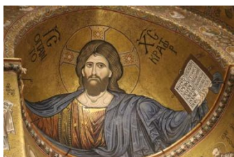
Monreale, Christ en gloire