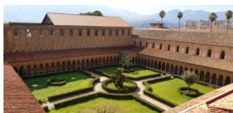
Monreale, le cloître