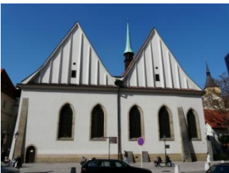
Chapelle de Bethléem

Poursuivant nos découvertes, nous nous arrêterons, entre autres, devant le Carolinum. Cette université a été importante dans l'histoire de Hus et des hussites, puisque Hus y a enseigné et en est devenu recteur. Après sa mort, les maîtres de cette université participèrent, en 1420, à la proclamation des « Quatre articles de Prague » qui entérinaient la réforme hussite.