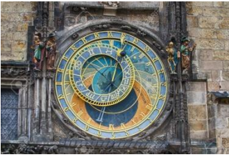
Horloge astronomique (vue partielle)

au plein centre, près du fameux pont Charles.