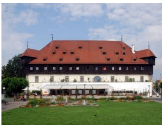
Constance, bâtiment du concile

Une heure de route nous suffiront ce matin pour rejoindre Constance, très jolie ville au bord du lac du même nom, siège du fameux concile qui condamna Hus en pleine crise de la papauté (papes à Avignon et à Rome). Nous y visiterons quelques lieux-clés, dont le musée qui lui est dédié, terminant ainsi notre voyage chronologiquement, par le lieu où il est mort.