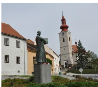
Husinec, statue de Hus

Il ne nous faudra qu'une heure ce matin pour arriver à Husinec, ville natale de Jean Hus. Nous y visiterons le musée qui lui est dédié, et nous aurons aussi un œil pour sa statue et une maison décorée avec des grandes figures de l'histoire des hussites.