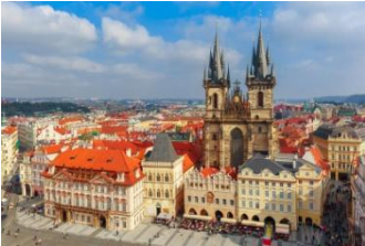
Place du marché et église du Tyn

Ce matin, après un temps libre, nous aurons le privilège d'une rencontre avec des responsables de l'Eglise des Frères tchèques, puis nous mangerons avec eux.