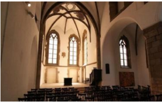
Eglise St Martin

Ensuite, une visite guidée nous emmènera vers les haut-lieux liés à la Réforme hussite. Nous débuterons par la chapelle de Bethléem, destinée à l'époque aux célébrations en langue tchèque, et son petit musée contigu, dédié au préréformateur.