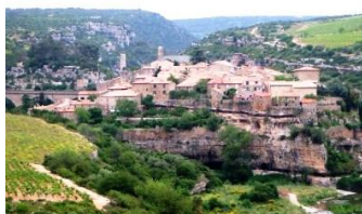
Le castrum de Minerve

Après le petit déjeuner, nous prendrons la route en direction de Mazamet où nous visiterons le musée du catharisme, très didactique, qui prolongera les informations reçues la veille sur le mouvement et l'histoire cathares.