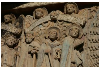
Conques, détail du tympan