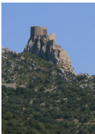
Château de Quéribus

Grande journée en perspective, avec la découverte de deux châteaux cathares, parmi les plus impressionnants ! La vue à l'approche de celui de Peyrepertuse est magnifique déjà plusieurs kilomètres avant l'arrivée ! Sur place, 20 minutes de marche en montée nous conduirons jusqu'à l'accueil, puis 20 minutes encore pour atteindre le château, avec le ou la guide qui nous conduira dans la découverte. Pour les personnes qui ne pourraient pas faire la marche ou qui auraient le vertige, un DVD de visite du château sera visionné dans le car.