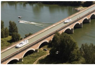
Moissac, le pont-canal