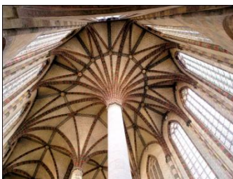
Toulouse, église des Jacobins, « palmier »

Journée toute entière consacrée à la grande et belle Toulouse !