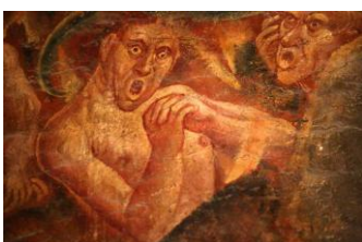
Albi, cathédrale, détail du jugement dernier...

Journée plus calme, mais néanmoins riche, aujourd'hui.