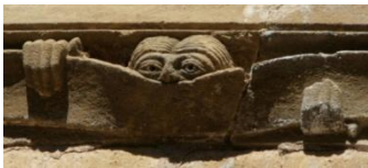
Conques, le curieux qui, depuis des siècles, observe ceux qui l'observent...

Conques, qui est au programme d'une grande partie de notre journée fait partie de ces lieux qui vous happent et dans lequel vous vous sentez immédiatement non seulement bien, mais relié. Au cœur d'un magnifique petit village à flanc de coteau, l'abbaye romane est là, en relai sur le chemin de St Jacques de Compostelle, pour nourrir la foi du pèlerin. Le site est superbe, le tympan émeut par sa richesse et sa beauté, la pierre enchante par ses tons ocre. Le village, à distance des parkings, vit au rythme des pèlerins.