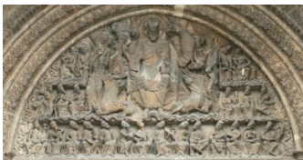
Moissac, le tympan

Après avoir pris le petit déjeuner et chargé nos bagages dans le car, il sera enfin temps d'aller visiter Carcassonne et son fameux château comtal !