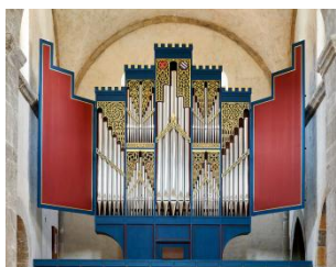
Orgue de l'abbatale