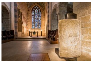
Abbatiale de Romainmôtier