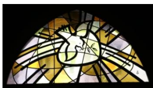
Eglise paroissiale, vitrail