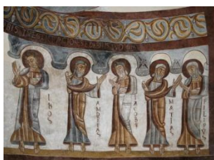
Montcherand, détail des fresques

Pour cette première journée, nous nous rendrons à Romainmôtier où nous débiterons par une visite guidée de la magnifique abbatale, humblement lovée dans son creux de vallon. Nous découvrirons son architecture, ses fresques, ses chapelles, son ambon, son harmonie générale.