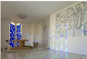
Vence, chapelle du Rosaire

Comme la veille, nous commencerons par descendre à Nice, cette fois pour visiter le musée Matisse, situé en haute ville. La visite du musée se termine par les différents plans et croquis qu'il a fait pour la chapelle du Rosaire à Vence. Nous découvrirons l'histoire de la rencontre riche et fructueuse entre Matisse et son infirmière, devenue sœur au Rosaire, rencontre qui sera à la base de la décoration de la chapelle !