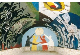
Vallauris, chapelle Guerre et Paix

En cette dernière journée sur place, c'est Pablo Picasso qui sera à l'honneur !