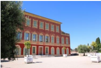
Nice, musée Matisse

Une journée hors du commun s'offre à nous, partagée entre la découverte d' Henri Matisse et la visite de la superbe fondation Maeght.