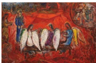
Musée Chagall, Abraham et les trois anges

C'est à Marc Chagall que nous consacrerons une grande partie de la journée ce vendredi !