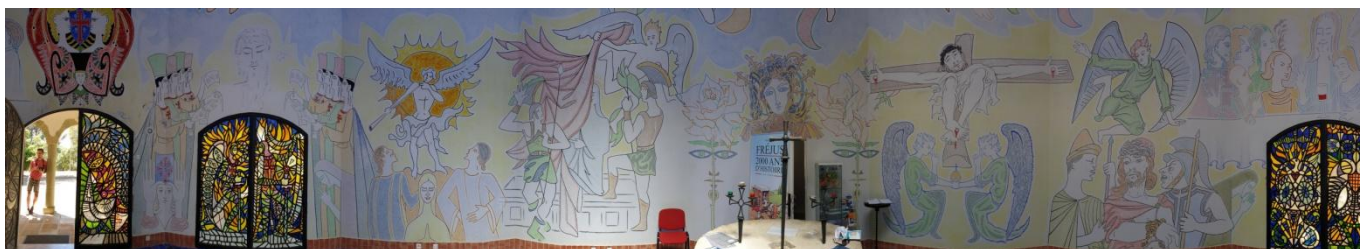
Chapelle Notre Dame de Jérusalem, peinte par Cocteau, vue panoramique

NB: Des changements de programme sont possibles. Cependant, le maximum sera fait pour pouvoir visiter l'ensemble des lieux prévus.