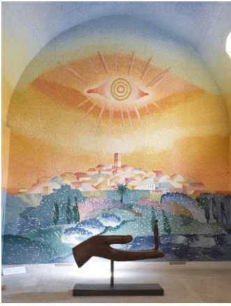
St-Paul-de-Vence, chapelle des Pénitents Blancs

sculptures, gravures bibliques et mosaïque complètent merveilleusement la collection.