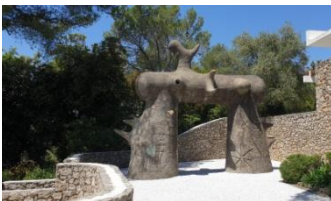
A la Fondation Maeght