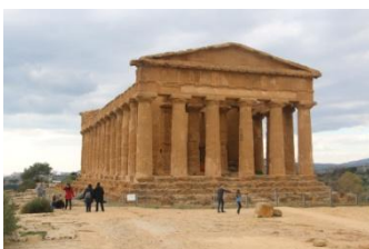
Agrigente, dans la vallée des temples

Un repas libre suivra sur le site, avant de poursuivre en direction d'Agrigente où nous arriverons en milieu d'après-midi.