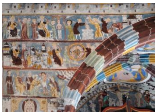
Eglise de Rhäzuns

Puis, pour conclure notre parcours grison, nous irons, par une petite balade à pied de quinze minutes, visiter l'église St Georges de Rhäzuns, une église du 12 ème siècle, recouverte d'impressionnantes scènes bibliques. Nous pourrons les découvrir à notre rythme grâce à des plans explicatifs.