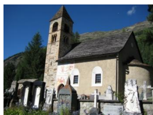
Sta Maria, Pontresina