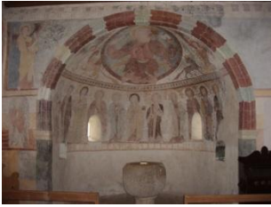
Chapelle de Clugin

Encore une magnifique journée en perspective! Nous commencerons par nous rendre à Zillis pour y visiter la fameuse église dont le plafond est constitué de 153 panneaux représentant, entre autres, de multiples épisodes de la vie du Christ. Nous visiterons également le musée dédié à cette église. Le repas se prendra librement dans le village.