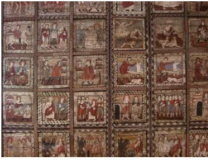
Plafond de l'église, Zillis